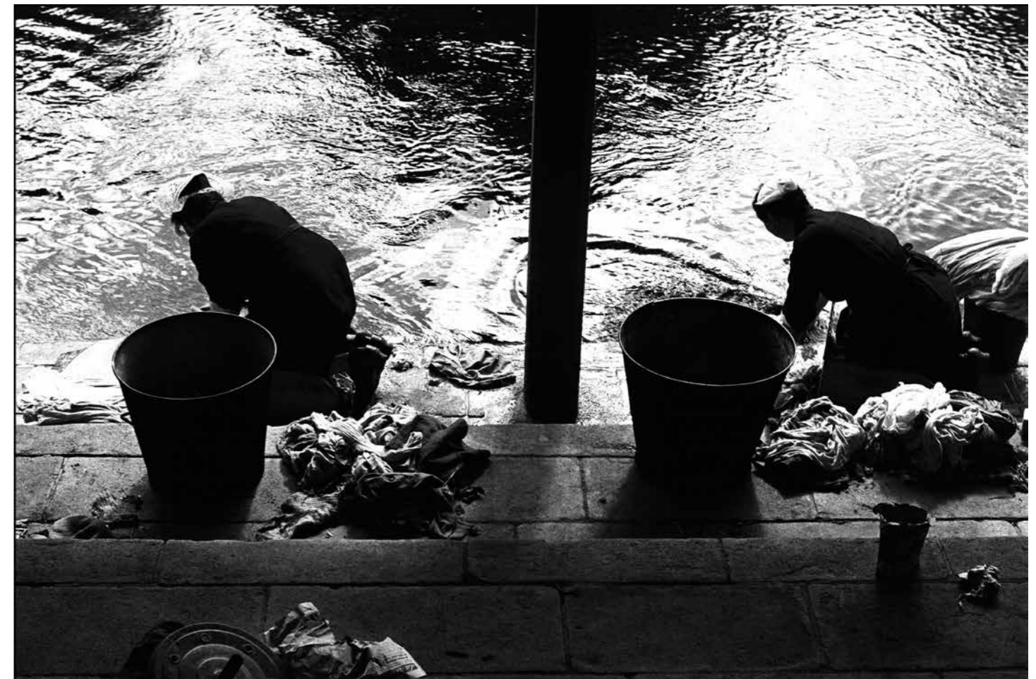
Les lavandières, Bretagne, 1954

Ces photographies grands formats ont ainsi été rigoureusement choisies pour être présentées en extérieur. Les gestes, costumes, cérémonies qui nous semblent aujourd'hui relever du folklore étaient alors bien une réalité.