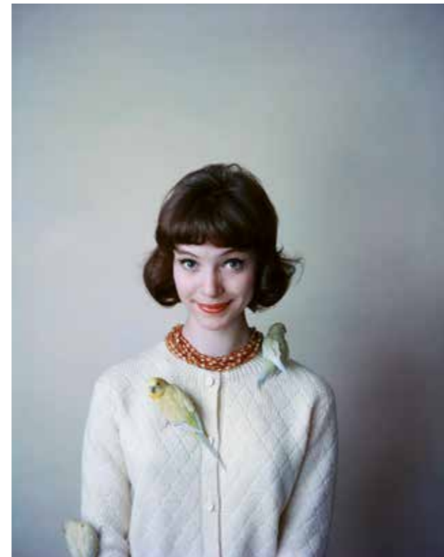
Anna Karina pour la marque Korrigan, 1958