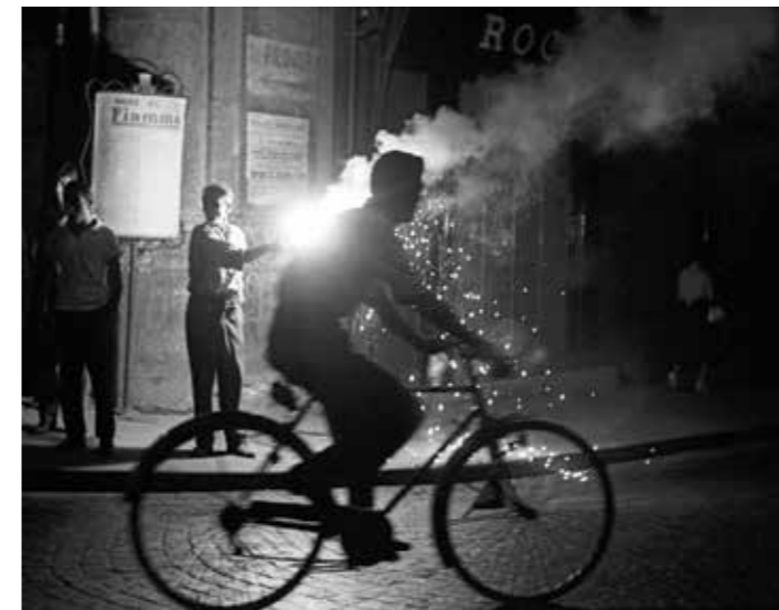
Feux de Bengale, Naples, Italie, 1955

Sociable et attirée par l'autre, qu'il soit proche ou lointain, Sabine Weiss est en phase avec cette mouvance qui fait de la vie quotidienne le sujet principal d'intérêt et d'observation. Ses commandes l'amènent à voyager dans toute l'Europe pour y photographier de façon très vivante la vie des habitants, leurs usages, leurs modes de vie, que ce soit en France, Italie, Grèce, Portugal, Espagne, Royaume-Uni, Allemagne ou au Danemark.