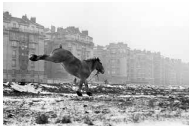
Porte de Vanves, Paris, 1952