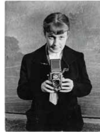
Sabine Weiss, autoportrait, 1953

2018 Exposition Les villes, la rue, l'autre , Centre Pompidou, Paris.