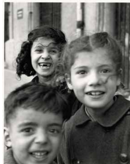
Porte de Saint Cloud, Paris, 1950