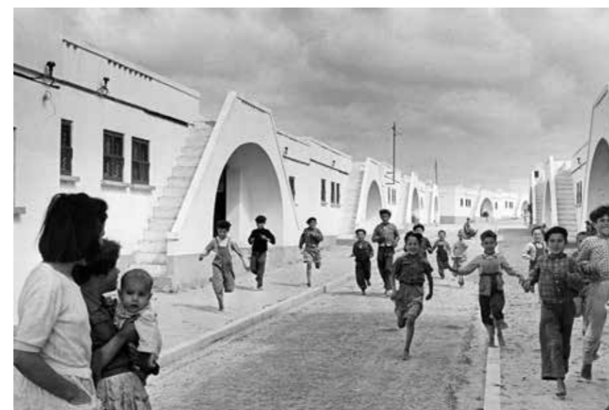
Village moderne de pêcheurs, Olhão, Algarve, Portugal, 1954