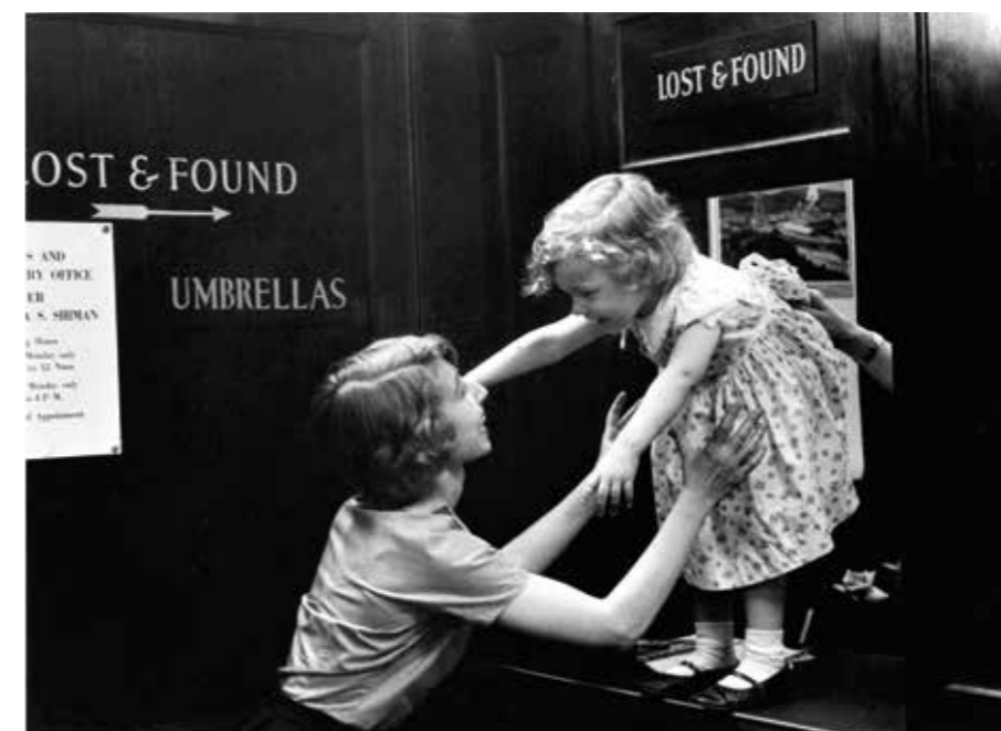
Enfant perdu dans un grand magasin, New York, 1955