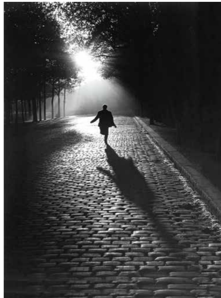
L'homme qui court, Paris, 1953