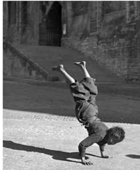
Devant le Palais des Papes, Avignon, 1946

Ses images se démarquent de celles de ses confrères Robert Doisneau, Edouard Boubat ou Willy Ronis. Chez Sabine Weiss, les attitudes et visages de l'enfance sont un miroir de l'âme humaine, laquelle se révèle davantage que chez les adultes, habitués à porter un masque et à dissimuler ou maîtriser leurs sentiments. Loin de la commisération ou du simple amusement, c'est dans l'empathie, le partage ou l'identification silencieuse que la photographe se positionne. Sa présence s'y lit dans le regard poignant de ces enfants des rues.