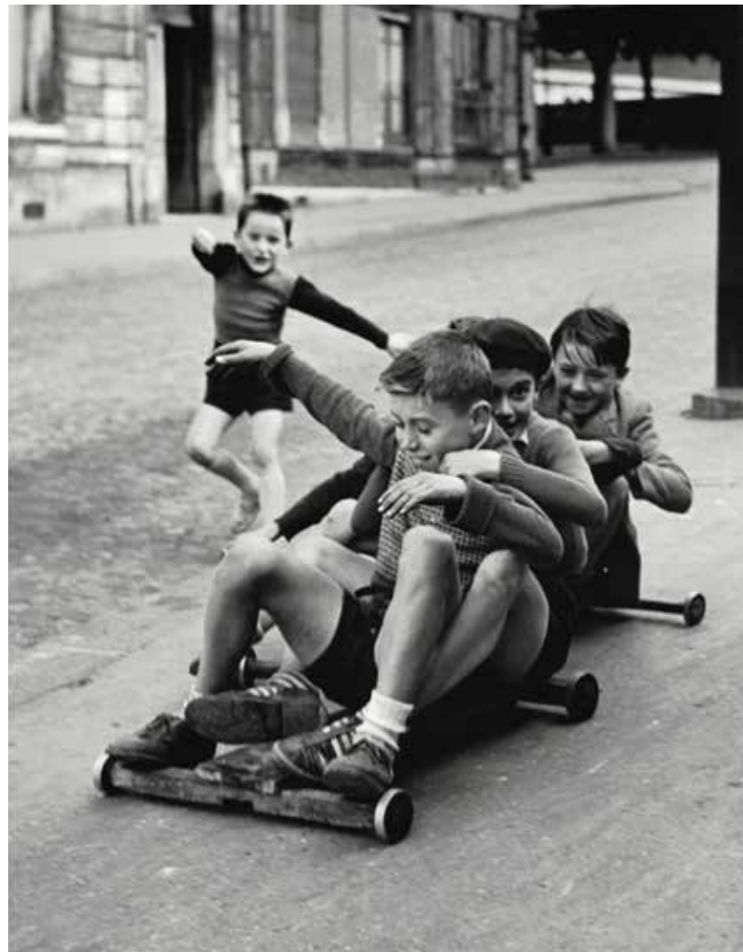
Rue Edmond-Flamand, Paris, 1952