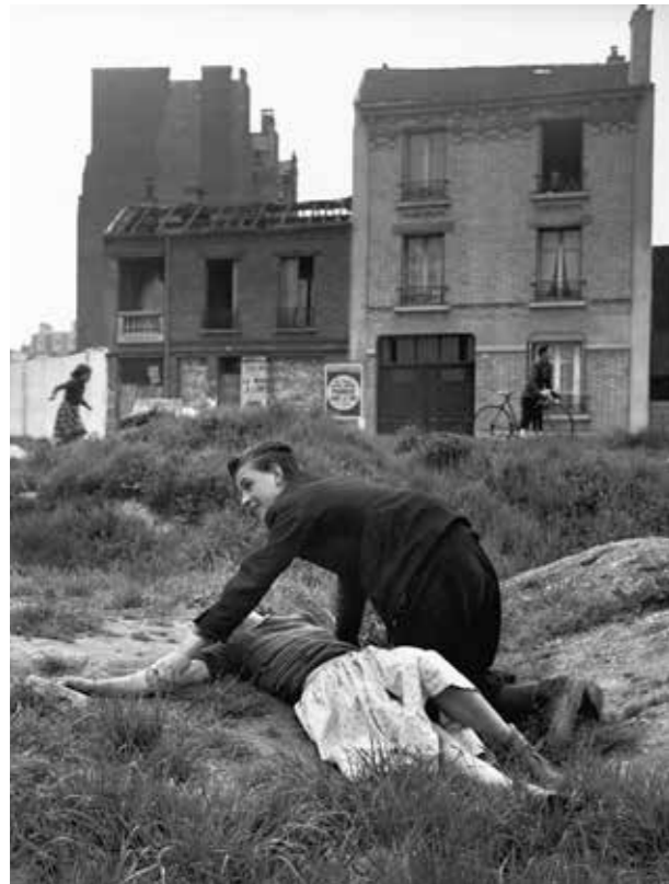
Porte de Saint-Cloud, Paris, 1950

Sabine Weiss arpente comme ses confrères les rues et atmosphères parisiennes, y trouvant des sujets variés d'observation et d'enchantement. Alors que Robert Doisneau s'attache à photographier la banlieue et Willy Ronis les quartiers de Belleville et de Ménilmontant, de nombreuses images de Sabine sont prises non loin de chez elle, entre les portes de Saint-Cloud et d'Auteuil. C'est dans ce quartier de l'Ouest parisien qu'elle capte certaines de ses images les plus emblématiques, comme celle des jeunes amoureux jouant dans un terrain vague en 1950.