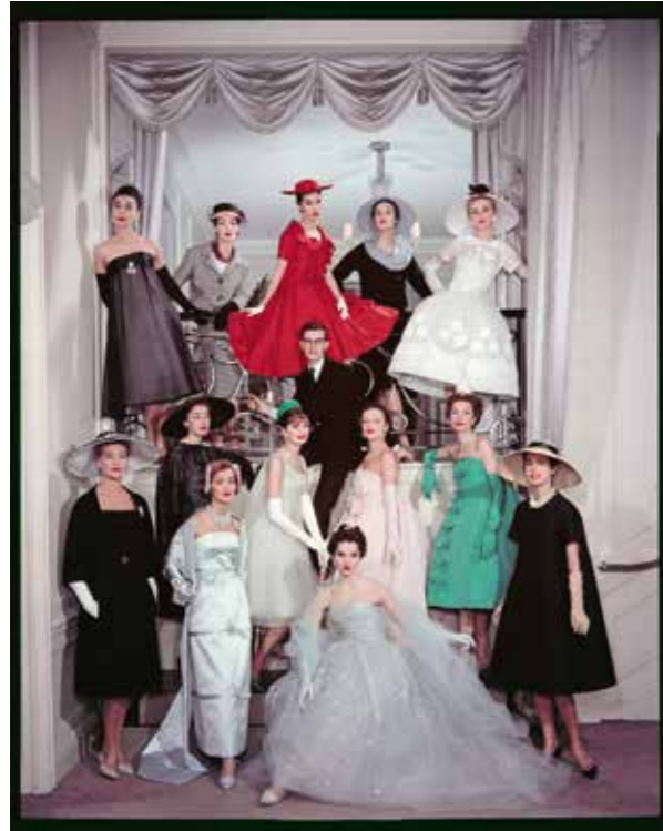
Yves Saint Laurent, première collection Dior, Paris, 1958

Année après année, elle y couvre les nouvelles collections de robes, chaussures, manteaux, chapeaux, dans des mises en scène et décors qu'elle conçoit elle-même, dans une veine souvent légère et drôle. Elle travaille ensuite pour de nombreux magazines de modes jusqu'aux années 1990.