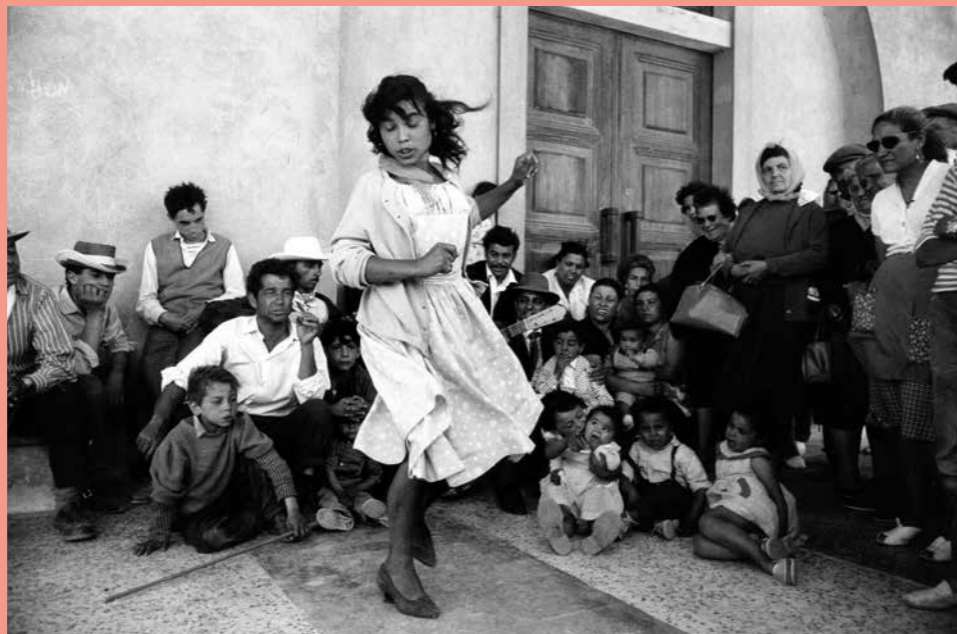
Gitane, Saintes-Maries-de-la-Mer, 1960

En complément de l'exposition, une sélection de photographies sur la Bretagne des années 50 par Sabine Weiss sera présentée en grands formats à l'extérieur à côté du Kiosque.