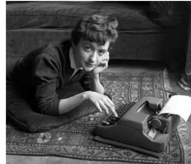
Françoise Sagan, Paris, 1954

Elle prend aussi, pour Vogue et d'autres magazines, de nombreux portraits d'écrivains, musiciens, chanteurs ou acteurs, comme Ella Fitzgerald et Charlie Parker, Léo Ferré, Romy Schneider, Brigitte Bardot, Delphine Seyrig, Roger Planchon, Françoise Sagan, Jeanne Moreau ou Simone Signoret. D'autres portraits sont réalisés pour un ouvrage intitulé J'aime le théâtre , qui paraîtra en 1962 aux éditions Denoël et Rencontre, et pour de nombreux magazines jusqu'aux années 1980.