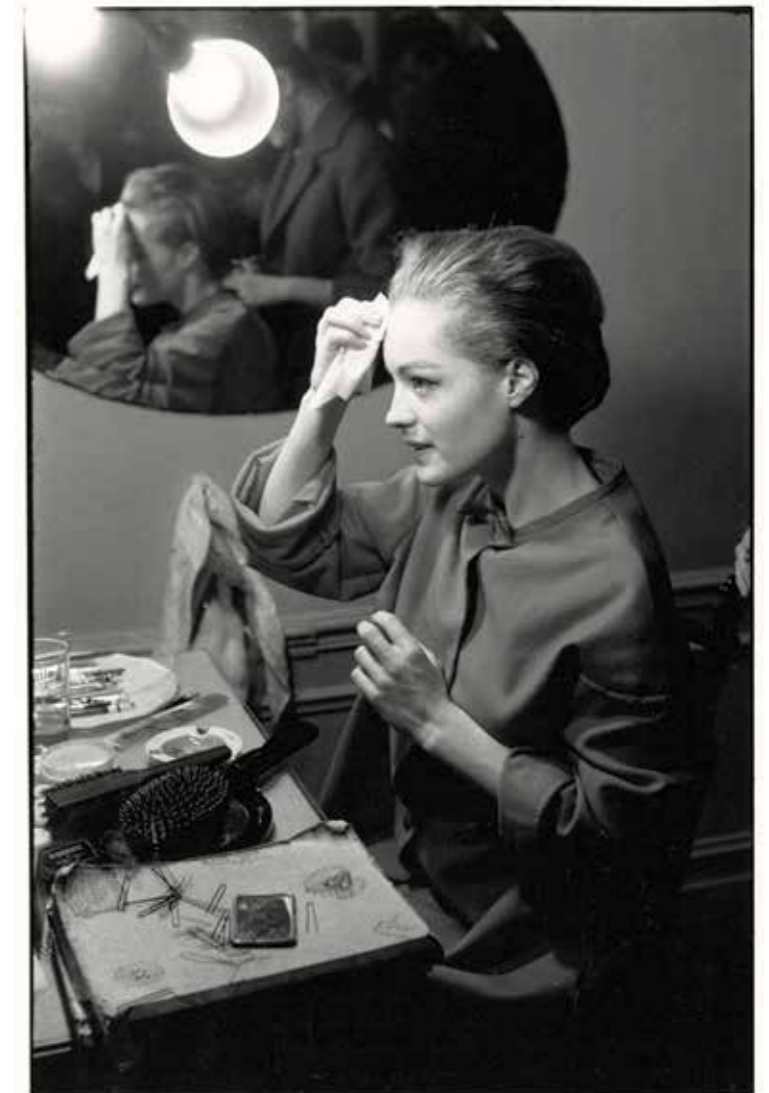
Romy Schneider, Paris, 1960