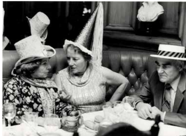
Saint-Sylvestre, Paris, 1981