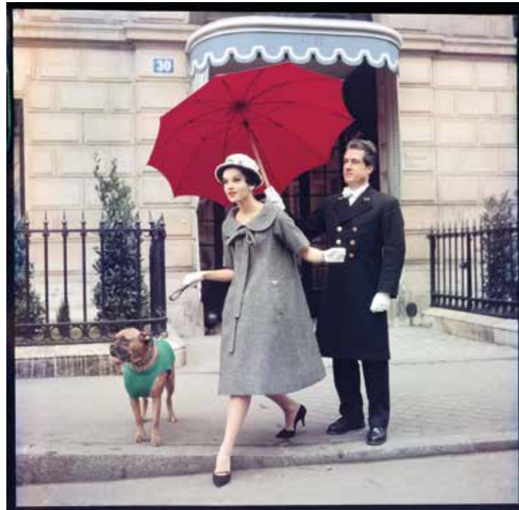
Chez Dior, Paris, 1958