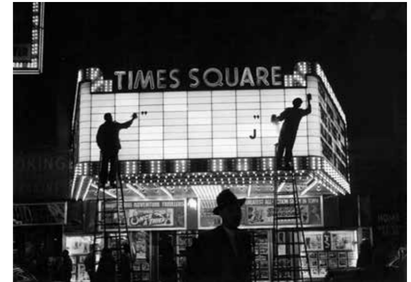
Times Square, New York, 1955

En 1953, Edward Steichen, le directeur du département photographique du Museum of Modern Art de New York, montre ses photographies dans l'exposition Post-War European Photography , ce qui lui vaut l'année suivante une exposition personnelle à l'Art Institute of Chicago. En 1955, The New York Times Magazine publie deux sujets consacrés à son regard de parisienne sur les New-Yorkais puis sur Washington, accompagnés de textes écrits par elle et portant la marque de son style, mélange de curiosité et d'humour.