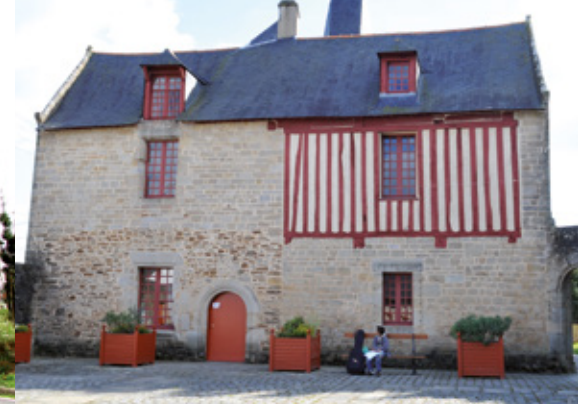
Manoir de Trussac