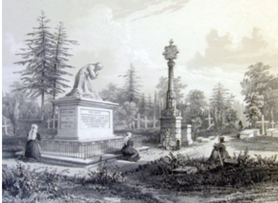
Cimetière Boismoreau, fin XIX e siècle

À 15H, AUTANT D'OCCASIONS POUR DÉCOUVRIR VANNES, SON HISTOIRE ET SON PATRIMOINE