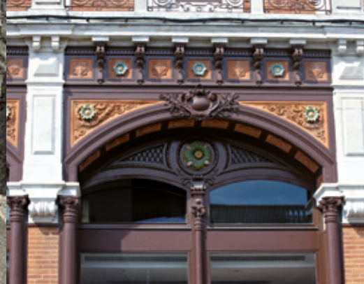
Immeuble Petit Fers