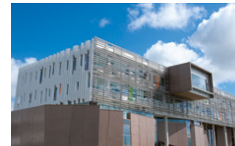
Faculté de droit et école d'infirmières