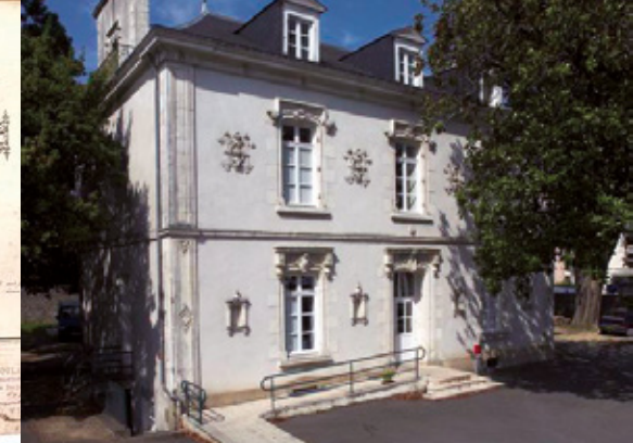
21 place de la Libération

Place Valencia - Sur réservation : 02 97 01 64 00 La visite donne accès à l'édifice.