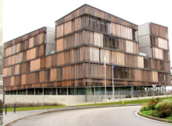
Direction départementale des territoires et de la mer du Morbihan