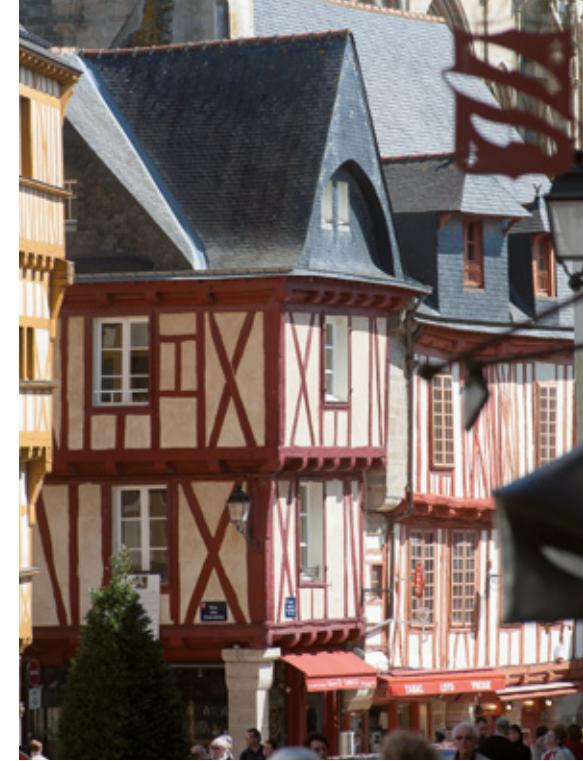
Place Henri IV

NB : d'avril à juin et septembre, la visite du dernier samedi du mois suit un parcours « confort » accessible à tous (avec pictogrammes PMR).