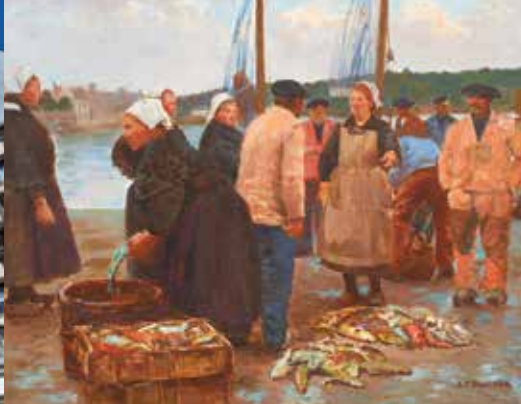
La Criée-Audierne, Joseph-Félix Bouchor

Tarif plein : 5,80 € - Tarif réduit (moins de 18 ans) : 3,60 € Gratuit pour les moins de 18 ans