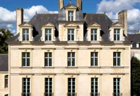
Hôtel de Limur