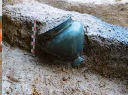
Vue d'un vase ossuaire en cours de fouille.

Musée des beaux-arts, La Cohue 15 place Saint-Pierre - Durée : 45 min