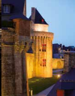
La Tour du Connétable