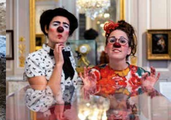
Grenade et Socratine pour parcours de clowns en ville.

Entrée du musée Tarif plein : 6,50 € - Tarif réduit (18-25 ans) : 4,50 € Entrée valable pour les 2 musées