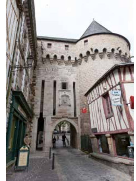
La Porte Prison

* Parcours « confort » accessible à tous (personnes à mobilité réduite, familles avec poussettes, personnes âgées)