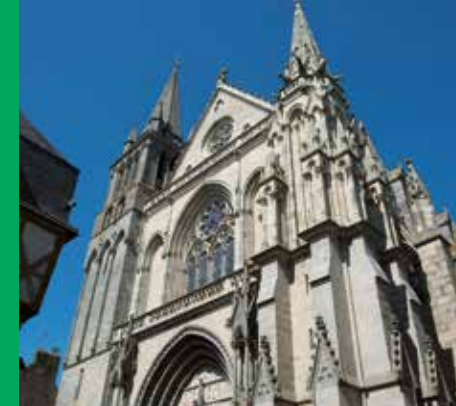
La cathédrale Saint-Pierre