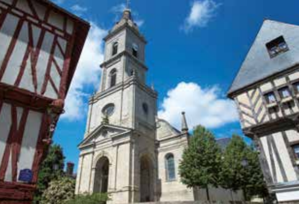
Le quartier Saint-Patern