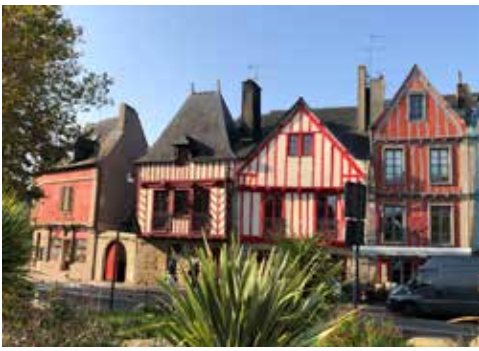
Maisons à colombages, rue du Port