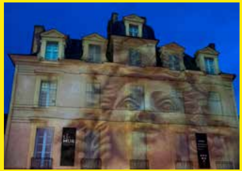
Mise en lumière de l'Hôtel de Limur

C'est en poursuivant les objectifs de développement durable de l'Agenda 2030 de l'ONU que, par exemple, les professionnels du patrimoine privilégient les restaurations qui tiennent compte des réemplois et des matériaux naturels, au plus près des exigences environnementales et que les monuments historiques impressionnent par leur résilience énergétique. Le patrimoine contribue à la redynamisation et au développement économique et touristique des territoires ainsi qu'à la conservation des