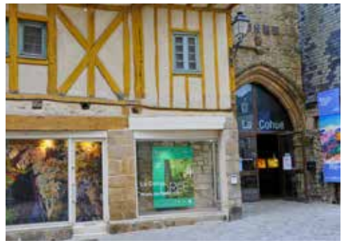
Musée des beaux-arts, La Cohue