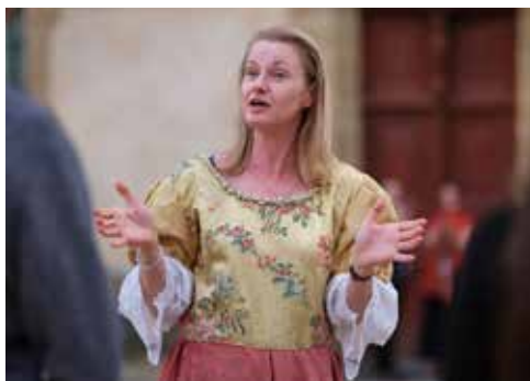
Visite guidée insolite