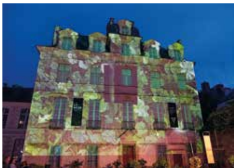
Spectacle son et lumière à l'Hôtel de Limur