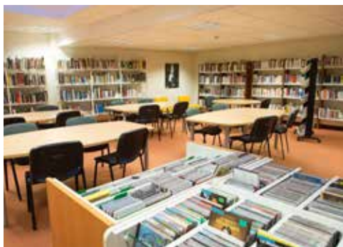
Médiathèque du Palais des Arts

Samedi 17 septembre 2022, Médiathèque du Palais des Arts sur réservation à 10h et à 14h30.