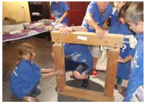
Atelier du patrimoine