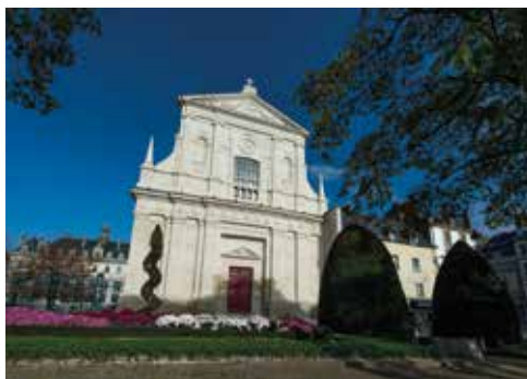
La chapelle Saint-Yves