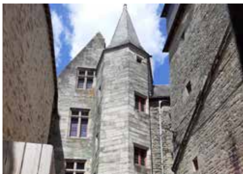
Musée d'histoire et d'archéologie, Château Gaillard