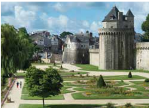
Jardin des remparts