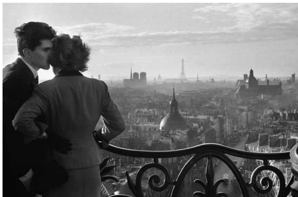
Les amoureux de la Bastille, Paris, 1957