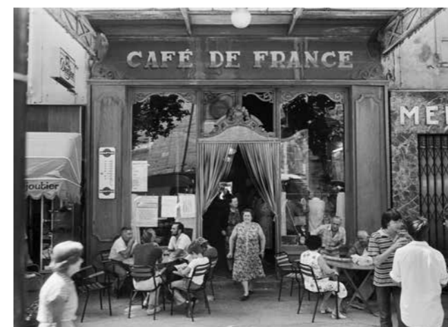
Willy Ronis, Le Café de France, L'Isle-sur-la-Sorgue (Vaucluse), 1979 © Donation Willy Ronis, ministère de la Culture, MPP, diff. RMN-GP

Le fonds Willy Ronis est affecté depuis 2016 à la Médiathèque du patrimoine et de la photographie (MPP), service à compétence nationale du ministère de la Culture qui conserve, d'une part, les archives des Monuments historiques et de l'Archéologie (9 km), de l'autre, le patrimoine photographique de l'État (20 millions de phototypes).