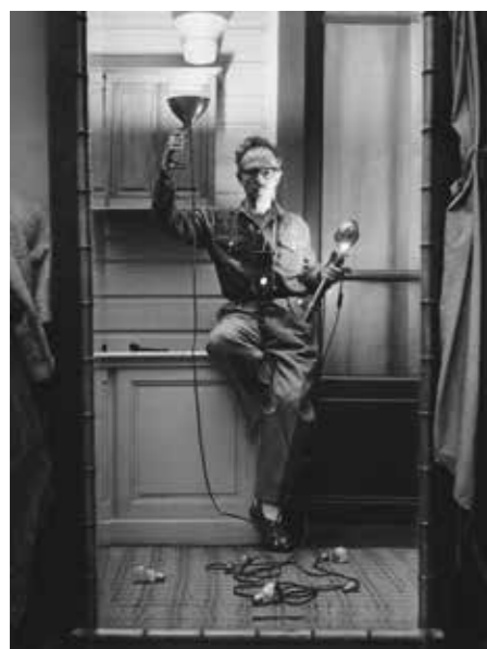
Willy Ronis, Autoportrait aux flashes, Paris, 1951

Du 10 décembre 2022 au 5 mars 2023, dans le cadre de la programmation annuelle du Kiosque, la Ville de Vannes vous invite à découvrir l'exposition Willy Ronis par Willy Ronis .