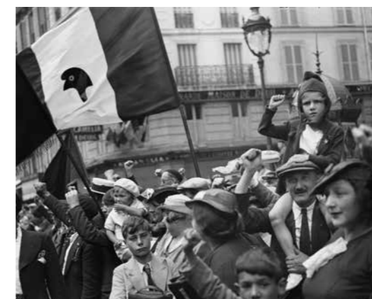
Willy Ronis, Pendant le défilé de la victoire du Front populaire rue Saint-Antoine, Paris, 14 juillet 1936 © Donation Willy Ronis, ministère de la Culture, MPP, diff. RMN-GP