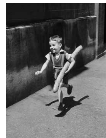
Willy Ronis, Le petit Parisien, 1952 © Donation Willy Ronis, ministère de la Culture, MPP, diff. RMN-GP