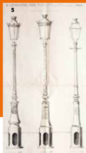
5. Modèles de candélabres par A. Lacarrière © Archives municipales de Vannes.