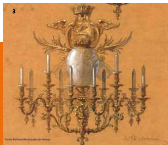
3. Dessin sur calque par Galy-Régaudière d'un lustre en bronze doré © Archives municipales de Vannes.