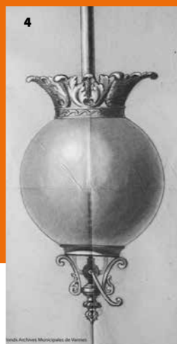
4. Dessin fusain par Galy-Régaudière d'un luminaire à suspendre en bronze et opaline