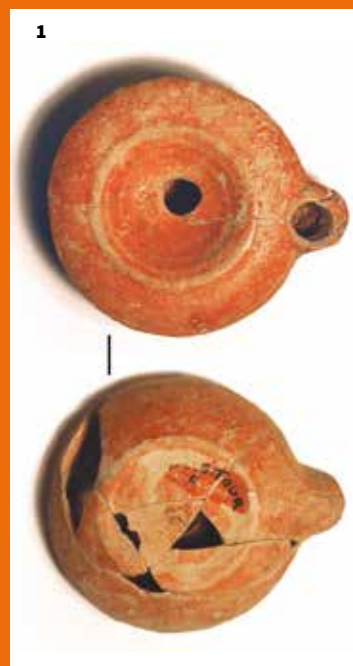
1. Lampe à huile gallo-romaine en terre cuite, fouilles archéologiques rue du Four, 1981 © Musée d'histoire et d'archéologie de Vannes.