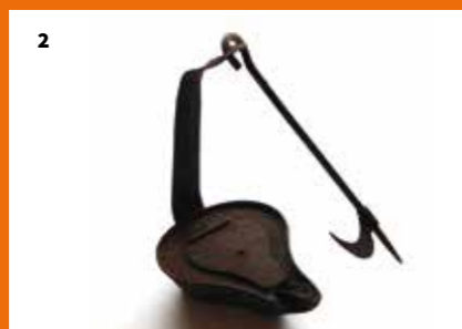
2. Lampe avec crochet de suspension, 19 e siècle