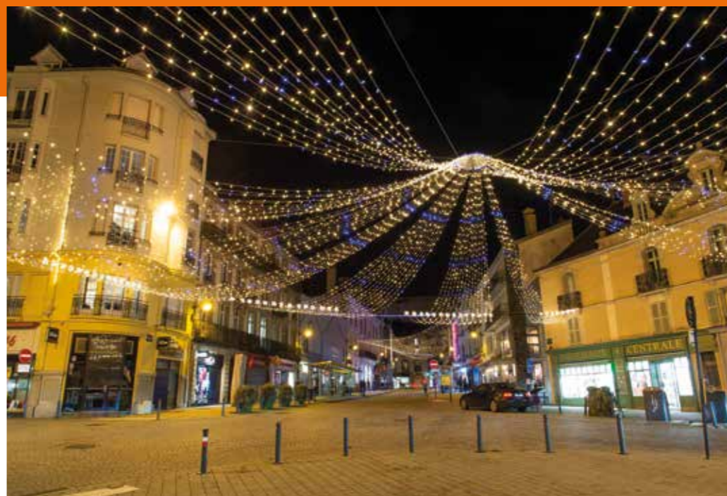
10. Illuminations de Noël, place Joseph le Brix, 2020 © Archives municipales de Vannes.