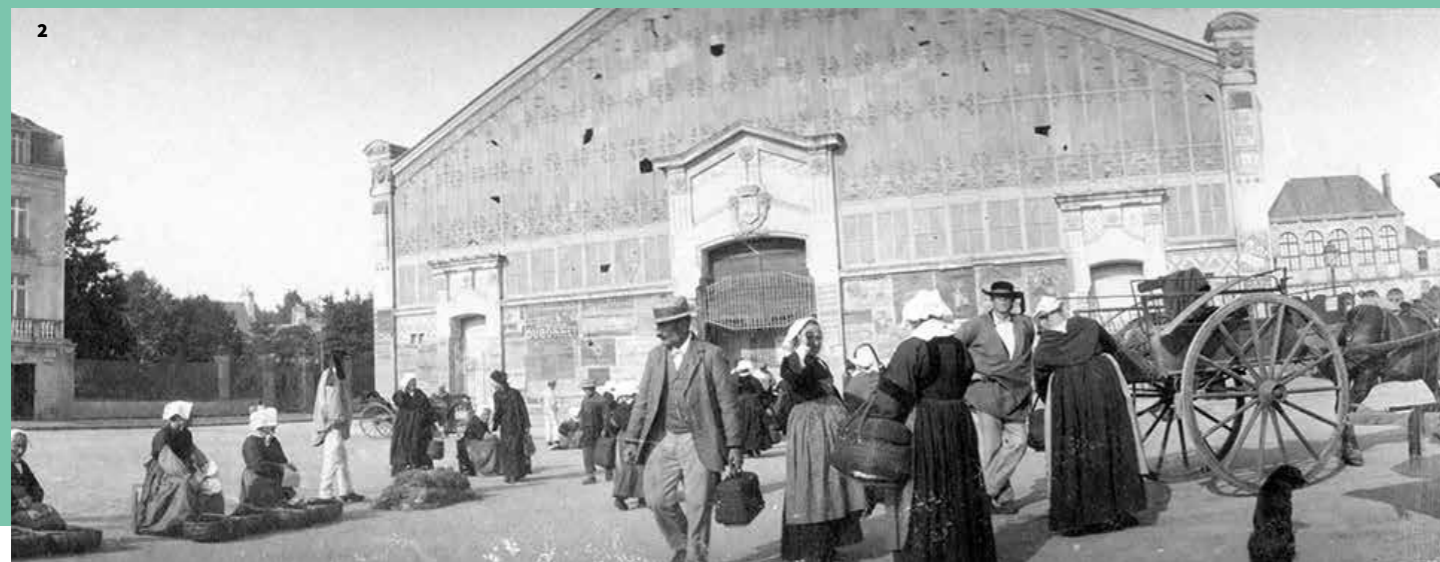
1. Ancienne halle des Lices, place des Lices. Fonds Archives municipales de Vannes. Construite à l'emplacement de l'ancien hôtel de Rosmadec, les plans d'une nouvelle halle sont dressés par l'architecte Paul Pleyber, en 1911. Le pignon ouest, donnant sur la place est percé d'un porche central surmonté d'un arc outrepassé dont les pilastres et voussures sont ornés de céramique et briques, émaillées et colorées qui donnent à la façade un bel effet de polychromie.