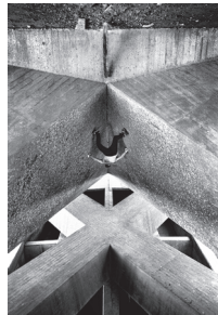
Angle en contre plongée