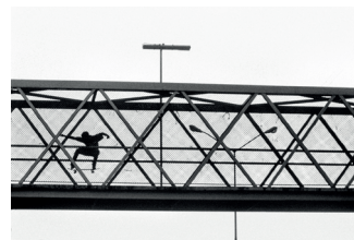
Angle de face

Quand je me place en dessous de mon sujet, il paraît plus grand. Quand je me place au-dessus de mon sujet, il paraît plus petit.