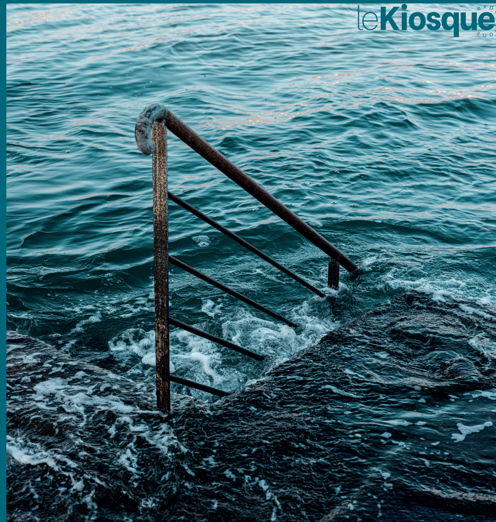
Direction de la communication - Ville de Vannes / Photo : Entrer dans la ville d'Ys © Benjamin Deroche / Fovart's

Médiation culturelle contact.kiosque@mairie-vannes.fr