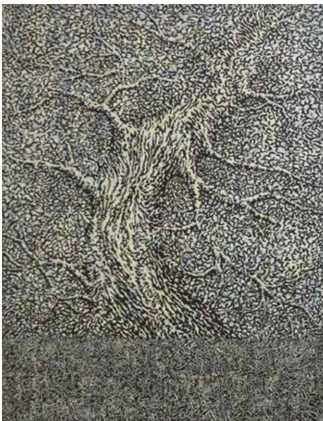
Béatrice Bescond - Prométhégo Asur T - 1998 Acrylique sur toile, 146 x 114 cm

Deux artistes, Béatrice Bescond et Jacques Le Brusq, dialoguent en peinture autour du thème de l'arbre. Deux regards qui nous proposent, bien au-delà de la seule représentation du végétal, une déambulation dans un univers poétique et méditatif.