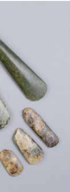
Tumulus de Tumiac, fonds SPM © Musées de Vannes