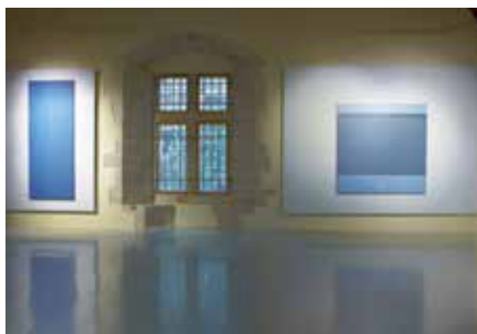
Vue de la salle haute du musée. Espace Geneviève Asse.