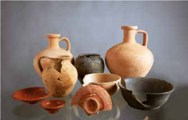
Vaisselle retrouvée dans le puits gallo-romain