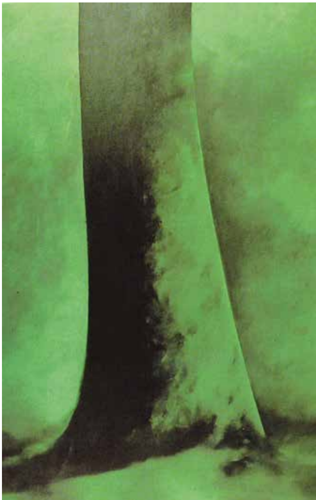
Jacques Le Brusq Les quatre faces du chêne, vers l'Est - 1986 Huile sur toile, 205 x 145 cm