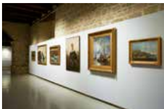
Espace des Collections XIX e et XX e siècles.

Actuellement, l'œuvre emblématique des collections Le Christ sur la croix peint par Eugène Delacroix participe à l'exposition consacrée à l'artiste et présentée au Metropolitan museum de New York du 12 septembre 2018 au 6 janvier 2019.