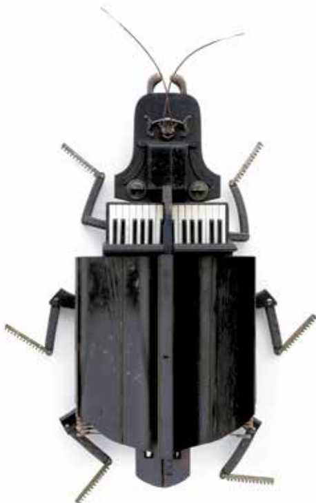
Scarabée © Mathieu Desailly

DU 13 OCTOBRE 2018 AU 6 JANVIER 2019, ACCÈS LIBRE DE 13H30 À 18H (SAUF LUNDI ET JOURS FÉRIÉS)