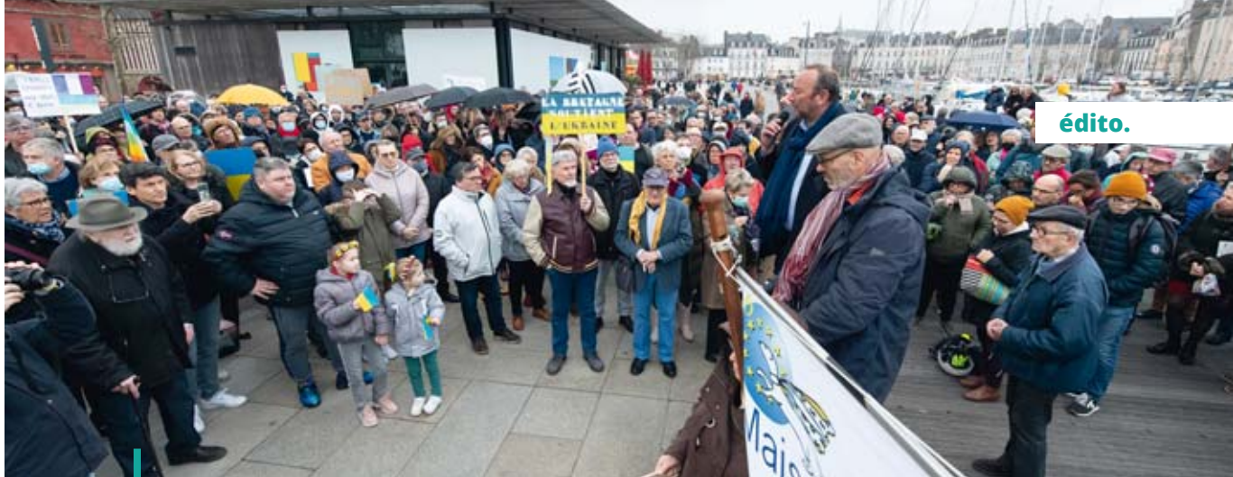
Rassemblement contre l'invasion russe en Ukraine, le 2 mars dernier sur l'esplanade Simone Veil.