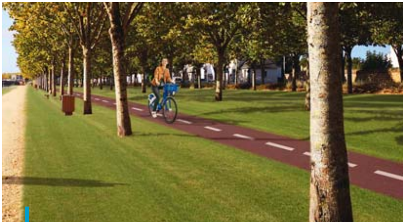
La nouvelle piste cyclable du mail de la Rabine, réalisée près du chemin de halage, sera livrée avant le début de l'été prochain.

Les cyclistes vont pouvoir profiter très prochainement d'une nouvelle piste cyclable sur le mail de la Rabine. Elle fait partie des aménagements du programme de requalification de cet espace urbain qui vient d'être replanté en grande partie et dont la grande allée centrale sera prochainement un nouveau poumon de verdure. Cette piste bidirectionnelle, de 1,55 km, longera le chemin de halage entre le steet park près de l'Office de tourisme et le parcours santé du Pont Vert. Sa mise en service est prévue pour la fin du printemps ou le tout début de l'été. D'autres aménagements cyclables (pistes et bandes) sont à l'étude en ce moment dans le cadre du plan vélo de la Ville de Vannes. Les élus et les services travaillent notamment sur un projet d'aménagement cyclable sur le boulevard des Îles pour raccorder la nouvelle piste que l'agglomération fait construire entre le giratoire du Vincin et celui de Botquelen (voir page 24) à celles du boulevard de la Résistance et du boulevard du Colonel Rémy. La Ville étudie aussi un projet de continuité cyclable entre la Tête noire et Séné-Le Pouffanc. L'aménagement cyclable du giratoire de Sainte-Anne fait également partie des réalisations à moyen terme, en vue de finaliser un projet de piste cyclable le long de la route de Sainte-Anne conduit par l'agglomération. Quant à la piste cyclable expérimentale entre la Tête Noire et la Madeleine, que d'aucuns qualifient de « coronapiste »